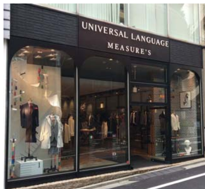
ユニバーサルランゲージ メジャーズ渋谷神南店