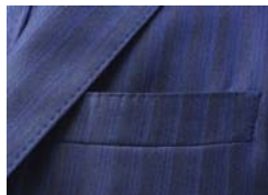
胸ポケットバルカ仕様