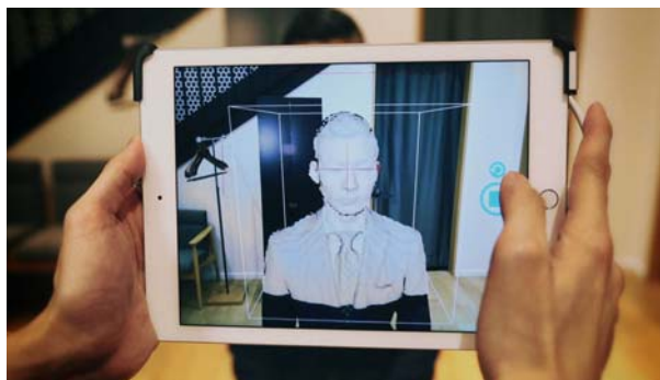
3Dカメラで頭部を360°撮影