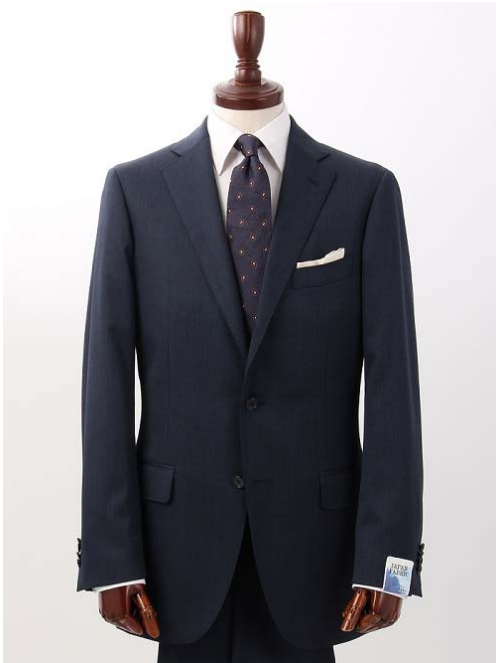
<メニック染めツイルスーツ>

特殊な染料で、染色の深度を意図的にばらつかせ染めムラを出す染色方法です。今回のコラボ企画では、インディゴを意識した色合いに仕上げています。