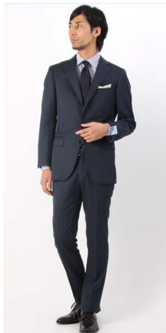
&lt;メニック染めスーツ&gt;

雑誌「 ビギン Begin」×「 ザ THE SUIT カンパニー COMPANY」コラボ企画商品