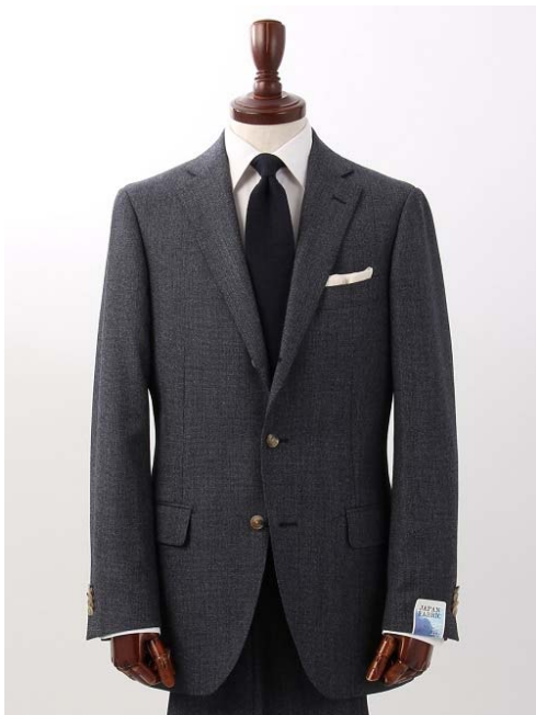
<スパイストップ染めシャークスキンスーツ>

日本伝統の「カセ染め」の技法を使った特殊な綿の染色で、インディゴの様な味わい深い色合いが特徴です。