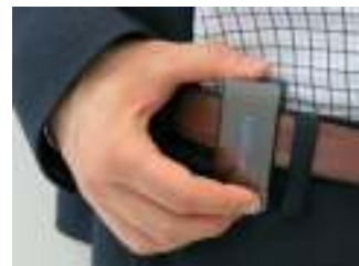
本プロジェクトに用いる IoT デバイス