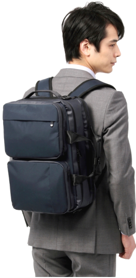
透湿防水素材を使用した 3WAY バッグ

※透湿防水素材「ブリザテック®」は、生地表面は水をはじくとともに生地内部まで水を浸透させず、撥水、防水性能と内部に滞留した湿気を外部に放散する性能を兼ね備えた高性能素材です。中層に形成した特殊なポリウレタンの微多孔質膜構造により、水滴はこの膜を通すことができず、湿気は通過して外へ放出します。その特性からレインウェアなどにも使用されています。