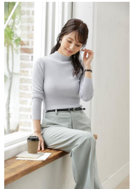
着用カラー：サックスブルー